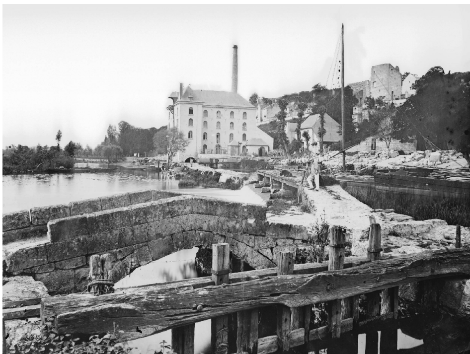
Source : Archives de la Ville de Saumur, collection Georges Perrusson, cote 34FI_0203, vers 1880 (?).

L'assemblée générale des Voiles de Loire se tient cette année au bord du Thouet, c'est l'occasion de retracer l'histoire de cette rivière et le canal de la Dive tous deux déclassés à la navigation. On verra que si les projets de relier le Thouet au Layon avaient été réalisés, les bateliers de Chalonnnes ou Montjean auraient pu rejoindre Saumur par un canal !